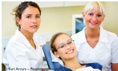
Regelmäßige Professionelle Zahnreinigung in der Praxis hält die Zähne hell und schützt vor Karies, Parodontose und Mundgeruch

Das hält nicht nur die Zähne länger hell. Es schützt sie auch vor Karies und Parodontose und es vermindert möglichen Mundgeruch .